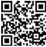
定期救命講習 申込