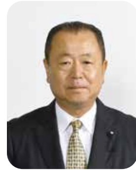
溝口 耕太郎 議長