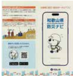
(和歌山県防災ナビ)