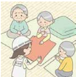
(避難所のイメージ図)