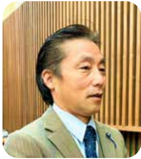
よこはた しんじ 横畑真治 議員

答 町では、介護度や障害の程度に応じて作成した「避難行動要支援者名簿」に基づき、その特性に応じた情報伝達や避難誘導方法を定める「個別避難計画」の作成をお願いしており、2月末現在で作成された方は5〜2名となっている。